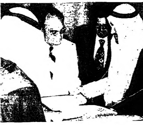
الملك خالد ورئيس المكسيك بنيدان القادرات

بدأ الملك خالد بن عبد العزيز محادثات مع الرئيس المكسيكي انطونيو لوبيز ماتيوس في قصر الملك خالد في الرياض . وتناولت المحادثات قضايا البترول وازمة الشرق الاوسط ، وذلك في اطار جملته العامة ، وذلك في اطار جملته العامة ، وذلك في اطار جملته العامة .